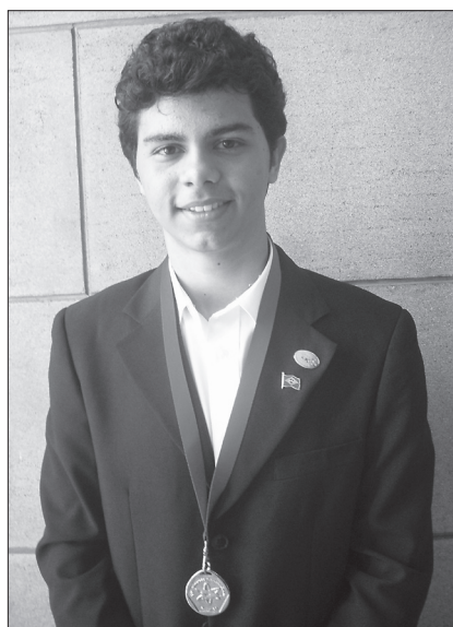
Levindo, medalha de ouro - 14 ª OIAQ, medalha de prata - 41 th IChO.