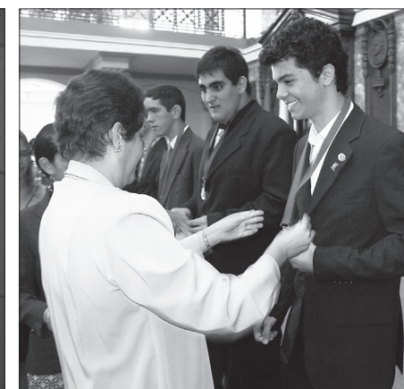
Ministra da Educação de Cuba, Ena Elsa Velázquez, premia Levindo, 1 º colocado na 14 ª OIAQ.